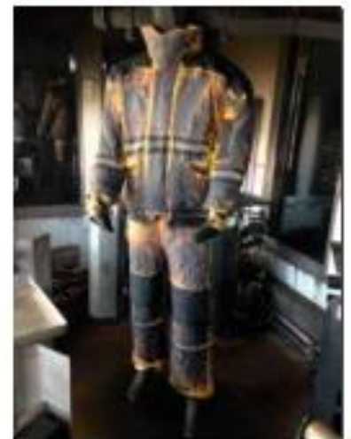
Traje después de la prueba