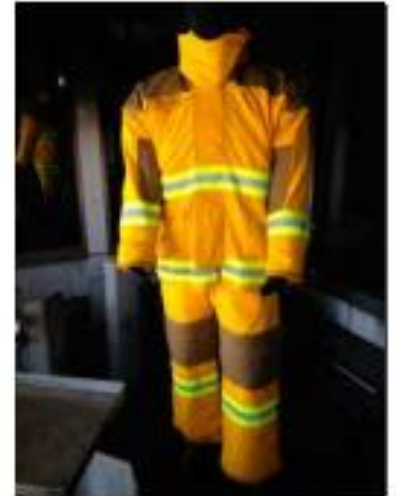
Traje antes de la prueba