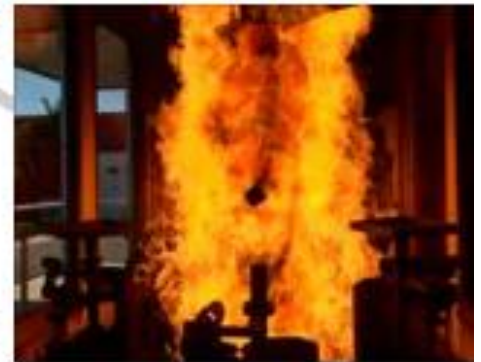
Traje durante la prueba